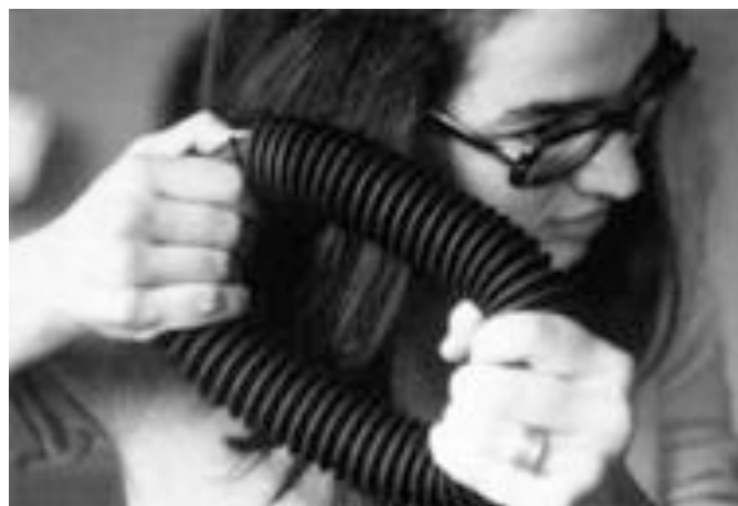
Lygia Clark, Respire comigo (« Respire avec moi »), 1966.

C'est en particulier le cas de Lygia Clark (1920 – 1988), artiste brésilienne qui s'intéresse à la perception, aux sens et à la réception de son travail via des objets relationnels. Son œuvre est ainsi le résultat d'une expérience proposée au visiteur par le biais de protocoles et de jeux, instaurant des « rituels sans mythe ». Ces objets, conçus comme des prothèses, viennent amplifier les sensations et la matérialité des corps. Pour Lygia Clark, cette relation sensuelle est également liée au psychisme. Sur la fin de sa vie, son travail aura une approche plus thérapeutique.