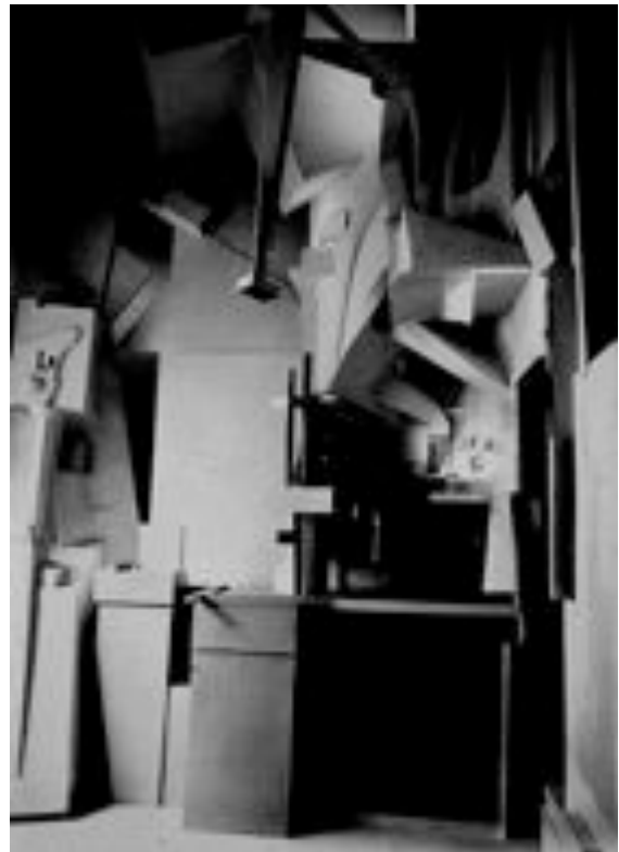
Kurt Schwitters, Merzbau , 1930, Hanovre

Participant de ce mouvement, Kurt Schwitters (1887 - 1948) construit une œuvre sous le nom générique de « Merz » (mot inventé par Schwitters et issue du mot « Kommerzbank») et s'approchera au plus près de la synthèse entre l'art et la vie. En effet, les matériaux de rebuts collectés dans la rue et dans son quotidien construisent toiles et sculptures. Sa démarche culminera avec le Merzbau , [littéralement : la maison merz] transformation de sa maison et de son atelier en sculpture monumentale.