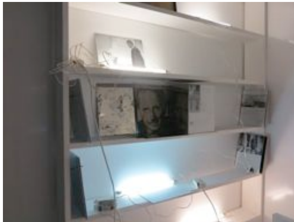
Laura Lamiel, Par ordre d'apparition , 2013 Matériaux divers, 210 x 130 x 130 cm

Si de prime abord l'œuvre apparaît minimale et froide par l'utilisation de la couleur blanche et l'utilisation de l'émail, procédé industriel, l'artiste livre au visiteur des indices, des bribes de son intimité.