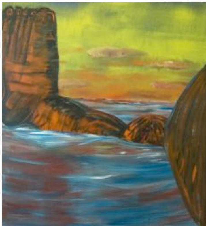
Benjamin Swaim, Sans titre , 2013 Huile sur toile, 240 x 220 cm Courtesy de l'artiste