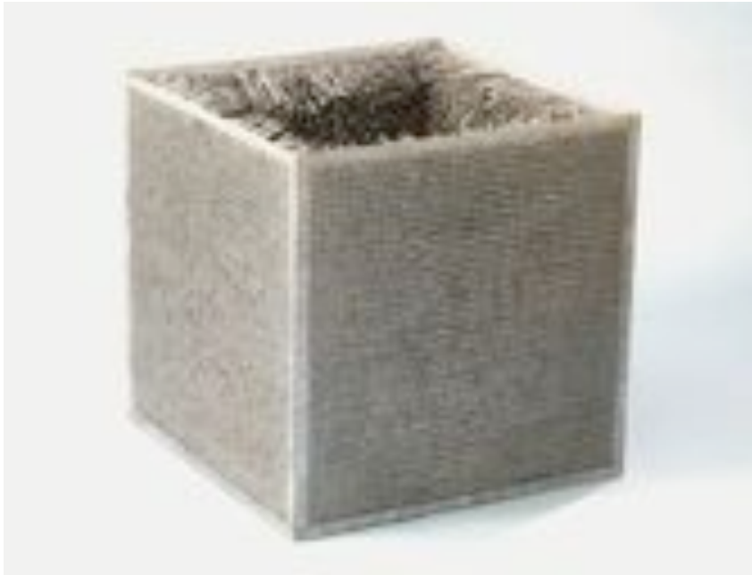
Eva Hesse, Accession II , 1968, [Detroit Institute of Arts, Detroit]

L'artiste américaine, Eva Hesse (1936–1970) reprend avec Accession II , 1968 la forme cubique chère à la sculpture minimale. Cependant, le matériau employé pour garnir l'intérieur du cube, évoque des éléments plus organiques comme la fourrure.