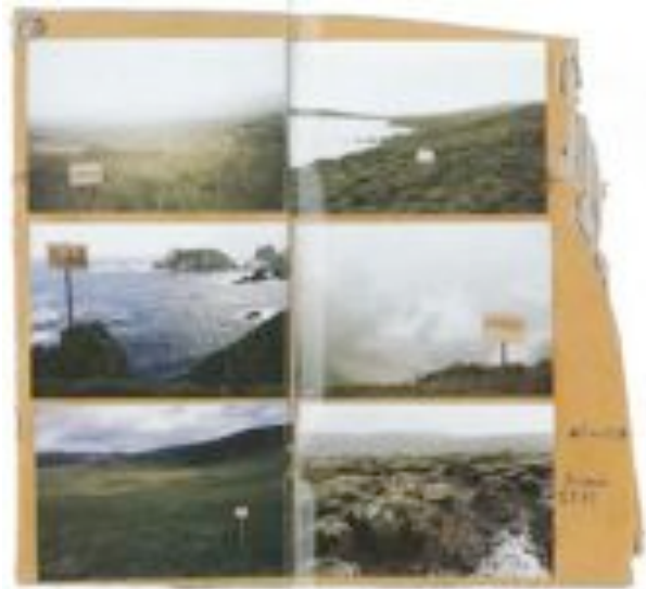
Thomas Hirschhorn, 6 mots , Irlande, 1989 Documents photographiques, 10 x 15 cm chaque, Courtesy de l'artiste

D'autre part, le spectateur peut à son tour imaginer le périple réalisé par l'artiste pour visiter ces landes désertes et sa confrontation à la nature. L'œuvre nous livre ainsi, si ce n'est son interprétation, des clés de lecture et les motivations qui sous-tendent le travail artistique de Thomas Hirschhorn.