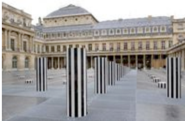
Daniel Buren, Les deux plateaux , 1985–1986 Installation permanente in situ , cour d'honneur du Palais Royal, Paris

En France, Daniel Buren (1938) choisit un toile de coton tissé, à rayures blanches et gris clair, alternées et verticales de 8,7 cm ( \pm 0,3 ) chacune, dont il recouvre les deux bandes extrêmes colorées, au recto, de peinture blanche. Ce motif et ses peintures variation sur ce même thème, sont installées dans l'espace de l'exposition ou l'espace urbain. Ainsi, l'œuvre ne révèle rien de son auteur, sinon le lieu ou la portion d'espace qu'il a distinguée. Dans ses écrits, il pointe cet anonymat de l'auteur en particulier en titrant "Il pleut, il neige, il peint" un article parut en avril 1970 (dans Arts Magazine, New York, vol. 44, n° 6). Ici le "Il" de l'auteur est aussi indéfini que le il de « il pleut ».