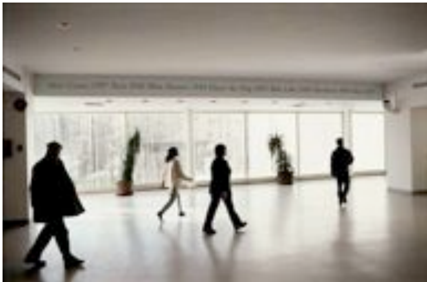
Felix Gonzales Torres, Untitled , 1989

Felix Gonzales Torres (1957–1996). Cet artiste cubain utilise des objets quotidiens et une approche formelle liée à l'art conceptuel pour aborder des sujets intimes (son enfance, sa sexualité, ses amours, la perte de son ami...) qui à des thématiques universelles (la mort, la guerre en particulier la guerre du golf, la violence...). Par exemple, Untitled , 1989 se compose d'éléments biographiques de l'artiste, peint à même le mur de la salle d'exposition tel un C.V. L'artiste s'engage dans son œuvre affectivement mais aussi socialement et politiquement.