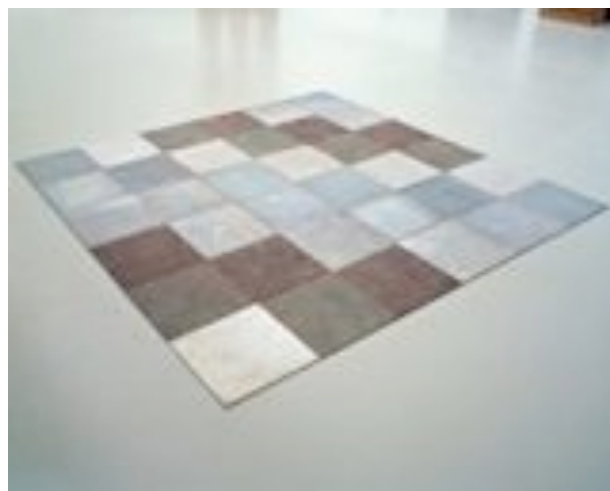
Carl Andre, Weathering square , 1970 Aluminium, acier, zinc, plomb, cuivre Kröller-Müller Museum, Otterlo, Pays-Bas