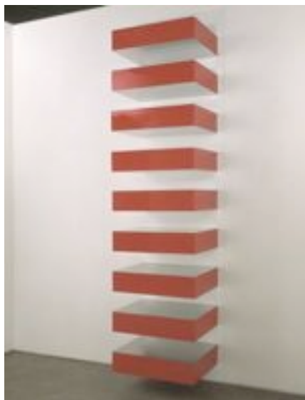
Donald Judd, Stack (pile) , 1972 Acier inoxydable, plexiglas rouge 470 x 102 x 79 cm Centre Pompidou, Paris

Aux États-Unis, dès le début des années 1960, l'art minimal avec des artistes comme Donald Judd (1928–1994) ou Carl Andre (1935), propose une approche radicale de l'œuvre d'art ramenée à sa dimension uniquement perceptive. Pour cela, les artistes utilisent des matériaux industriels, des formes géométriques simples basées sur un système sériel : cubes, plaques disposées au sol comme des tapis... Réduites à leur plus simple expression et vides de la présence de l'artiste, les œuvres donnent ainsi une place plus grande au spectateur qui peut alors se projeter plus facilement.