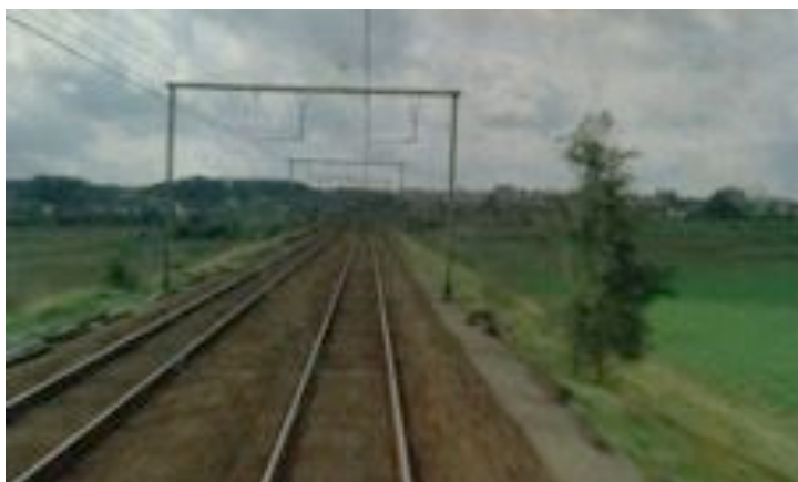
Chris Marker, Sans soleil , 1983. Film 103 min

Les dimensions à la fois personnelle et collective de cette série de vidéos, la présence du voyage et le procédé expérimental évoquent le cinéma de Chris Marker (1921–2012) et en particulier le genre du « film essais ». On retrouve cette approche dans le film Sans soleil , 1983 où le discours est construit par un caméraman fictif qui voyage du Japon au Cap vert. Il interroge ainsi les représentations du monde, la mémoire, l'engagement, obsessions du réalisateur.