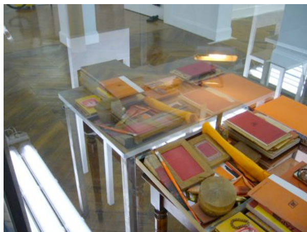
Qui parle ainsi se disant moi ? 2013 Acier, miroir espion, divers éléments 190 x 150 x 150 cm Courtesy de l'artiste et Marcelle Alix, Paris

Dans Qui parle ainsi se disant moi ? , c'est un miroir espion soutenu par un cadre en acier qui vient perturber l'espace. Selon la puissance et la position de la lumière, les objets situés derrière ce miroir sont dévoilés ou alors masqués.