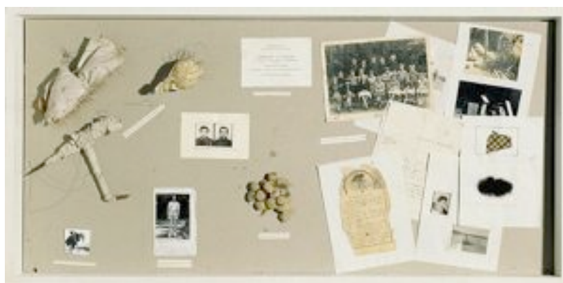
Vitrine de référence, 1971 Boîte en bois peinte sous plexiglas et divers objets : 59,6 x 120 x 12,4 cm

L'artiste possède d'immenses archives de personnes souvent disparues. À partir d'objets les plus intimes (photos d'identité, vêtements, lettres...), il crée des œuvres qui appellent au recueillement. Les photographies sont présentées à la manière d'arbres généalogiques et éclairées par la lumière tamisée des ampoules. La transparence des visages, la fragilité du support sont des métaphores du caractère éphémère de la vie et du souvenir. Christian Boltanski réalise également des vitrines où il dispose des objets hétéroclites. Il utilise de nombreux matériaux tels que des cheveux, de la terre, des morceaux de tissu, de fil de fer ou encore d'épingles. Marqué par le souvenir de l'holocauste, la mémoire collective ou individuelle, réelle ou imaginaire, devient alors l'un des thèmes récurrents de son travail.