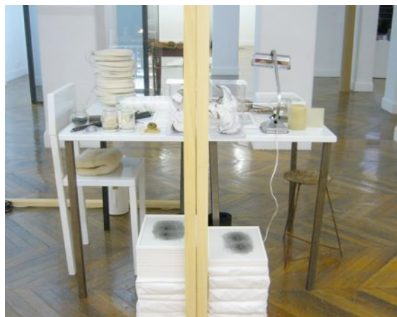
Chambre de capture , 2013 Bois, plexiglass, divers éléments 180 x 10 x 150 cm Courtesy de l'artiste et Marcelle Alix, Paris

Ce double, qui semble être le motif central de l'exposition (comme son titre l'indique), est encore une fois visible avec les deux photographies prises dans son atelier, Sans titre 1 (2000) et Sans titre 3 (2013). Elles sont identiques mais leur traitement est différent. L'une est à moitié recouverte d'un plastique noir alors que l'autre est cachée par un papier calque.