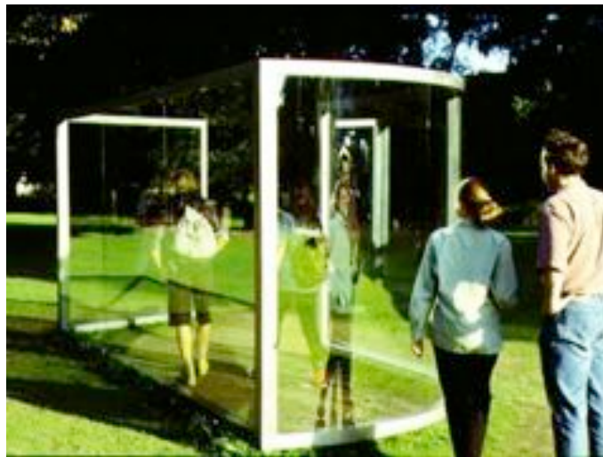
Fun house for Münster, 1997