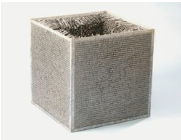
Accession II, 1968 Acier galvanisé, vinyle, fourrure 78,1 x 78,1 x 78,1 cm Detroit Institute of Arts, Détroit

Dans la série Accession , Eva Hesse choisit une forme emblématique de l'art minimal : le cube. Elle utilise des matériaux bruts, industriels mais aussi des matières organiques, « pauvres ». Le cube est réalisé en acier galvanisé, les versions suivantes seront en fibre de verre, la surface supérieure étant ouverte. Eva Hesse donne une dimension beaucoup plus intime à l'art minimal par l'ajout de fourrure, une matière douce, agréable au toucher et visible dans un second temps.