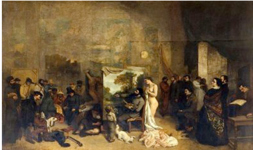
Gustave Courbet L'atelier du peintre , 1855 Huile sur toile 359 x 598 cm Musée d'Orsay

Avec l'avènement des nouvelles technologies, l'atelier de l'artiste contemporain peut prendre la forme d'une véritable entreprise où différentes professions se mêlent. Il peut aussi se réduire physiquement à un ordinateur portable.