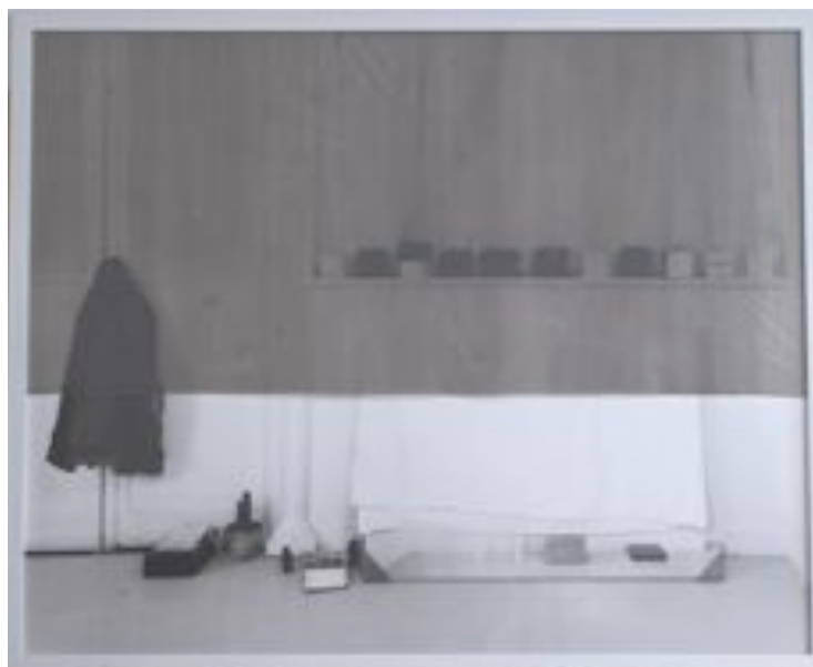
Sans titre 1 , 2000 Photographie barytée, technique mixte, 126 x 156 cm

« À la recherche d'un potentiel de transformation, Laura Lamiel fit de son atelier plus que le laboratoire des constituants de son langage, un lieu qui finit par faire œuvre. 3 »