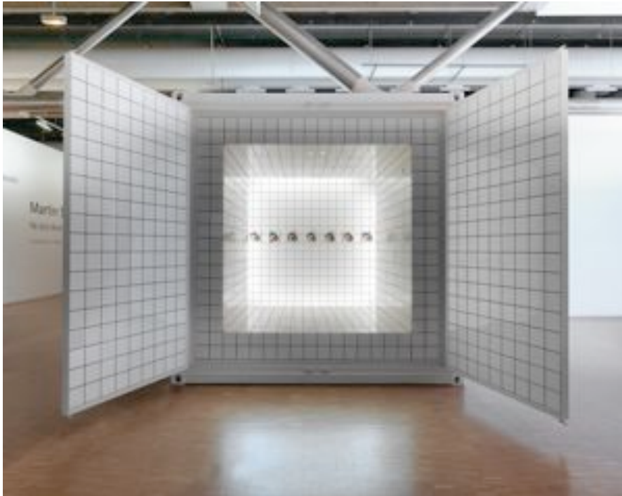
Container zéro , 1988 Carrelage, acier, électricité, objets divers 330 x 330 x 330 cm Centre Pompidou, Paris

Container zero a été créé pour le dixième anniversaire du Centre Pompidou. Jean-Pierre Raynaud a conçu un espace architecturé composé de carrelage blanc. Ces carreaux en céramique de 15 x 15 cm sont devenus depuis les années 1970 une des signatures de l'artiste. À l'instar des cellules de Laura Lamiel, de nombreux éléments peuvent être disposés à l'intérieur. Depuis 1988, des œuvres d'art de la collection du Centre Pompidou sont présentées (par exemple Croix noire de Malevitch, 1915) en alternance avec des créations de l'artiste et des objets avec une résonance toute particulière. Si ce container est un moyen de faire partager ses convictions artistiques, sociales et politiques, Jean-Pierre Raynaud s'investit aussi de manière plus intime, comme en 2002 où il a dévoilé une échographie de son futur enfant. Container zero est un véritable sanctuaire pouvant recueillir les souvenirs de l'artiste mais aussi des œuvres majeures du XX ème siècle.