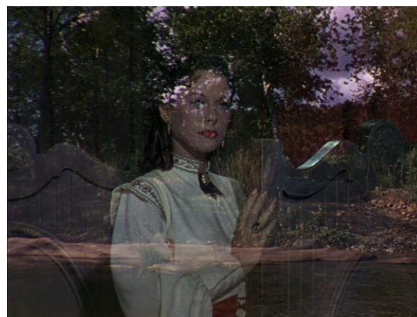
Camille Vivier, Serpent, miroir , 2015 Tirage jet d'encre sur papier baryté 46,5 x 33,5 cm