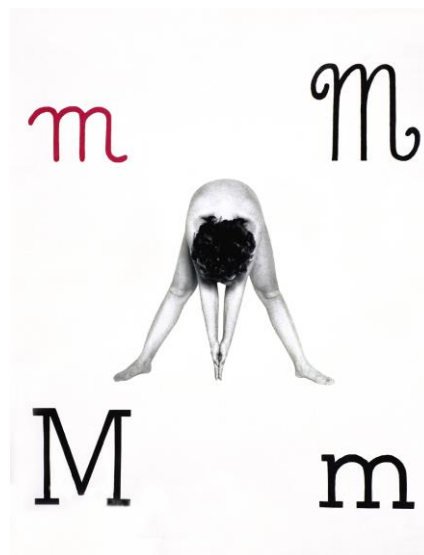
3. Alfabetiere murale [ Alphabet mural ], 1976 (détail) Collage photo sur carton, 21 éléments, 35,5 x 25,5 cm chaque Courtesy Archives Menna-Binga, galerie Tiziana Di Caro, Naples et galerie Frittelli arte contemporanea, Florence © Amedeo Benestante

Relations presse : Alyson Onana Zobo alyson.onana-zobo@noisylesec.fr