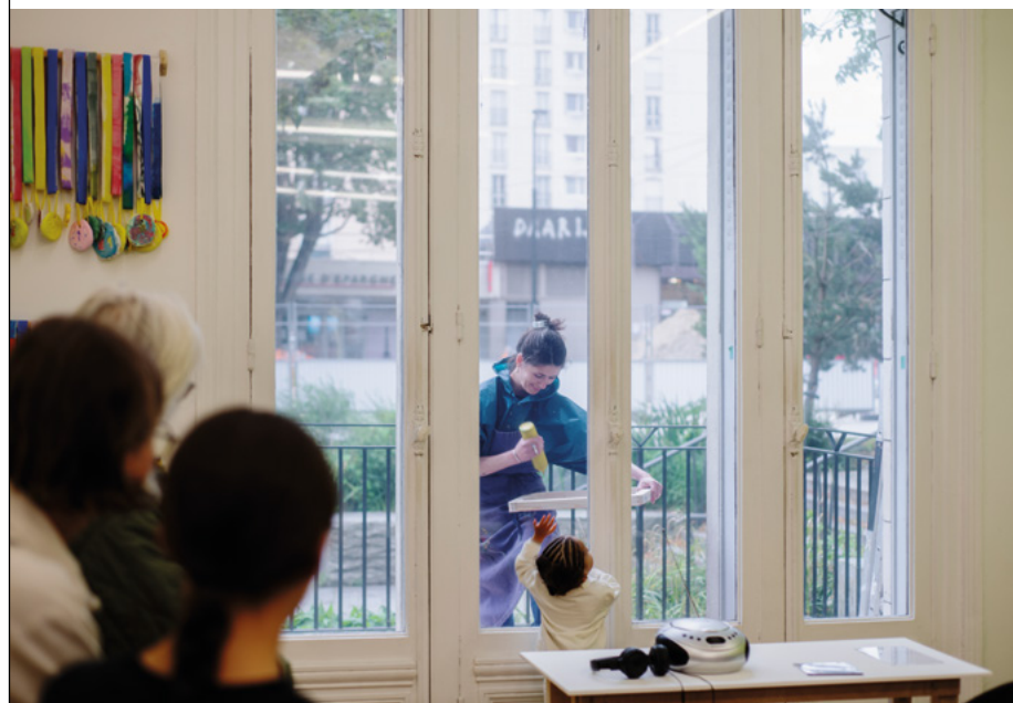
Performance Tous les soirs, elle tombe de Kim Bradford, Nuit Blanche 2025, juin 2025