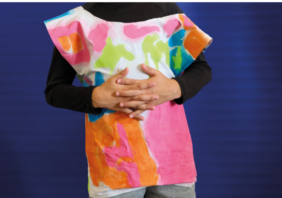
Atelier «Ramenez les coupes à la maison», Laura Burucoa, autour de l'exposition «Le Syndicat des Olympiades» de Jonathas de Andrade, novembre 2024